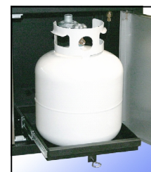
Cabaret pratique pour réservoir

665-300 MG1860 70" large x 26" prof. x 50.5" haut 270 lbs 320-160 Housse longue, matériel de qualité, doublée avec velcro 665-160 Ensemble de rôtissoire de luxe avec moteur acier inox. 120 V.