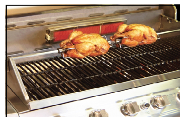
Brûleur infrarouge arrière